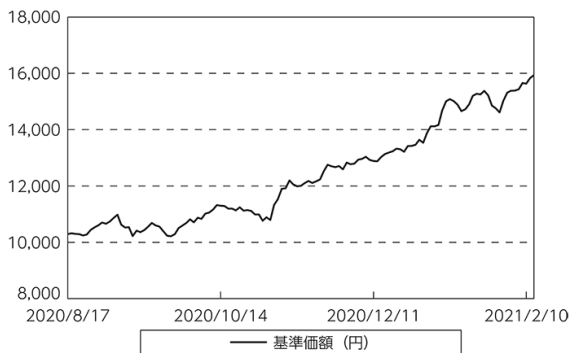
基準価額等の推移