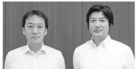
株式運用部 ファンドマネージャー

コロナ禍を経て人々の環境への意識が強まったことやカーボンニュートラルに向けて各国の足並みが揃ったことなどが重なり、世界自動車市場のEVシフトは加速局面に入ったと考えています。注目していた米国の環境規制については、2030年までに新車販売の50%を電動車（EV、燃料電池車、プラグインハイブリッド車）とすることをめざす大統領令が署名されました。世界2位の自動車市場である米国の環境規制が具体化したことで自動車メーカーの販売戦略がより明確化し、EVシフトの流れは加速するものと考えています。銘柄選択にあたっては、EV市場において強い競争力を有する企業や車載用リチウムイオン電池市場拡大の恩恵を受ける企業などに注目してまいります。