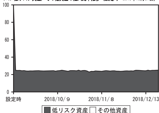
(%) 低リスク資産/その他資産の組入比率推移（設定時～2018年12月21日）