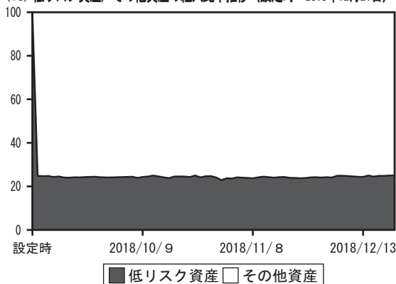
(%) 低リスク資産/その他資産の組入比率推移（設定時～2018年12月21日）