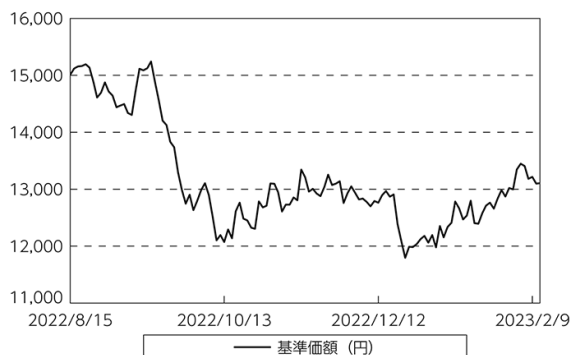
基準価額等の推移