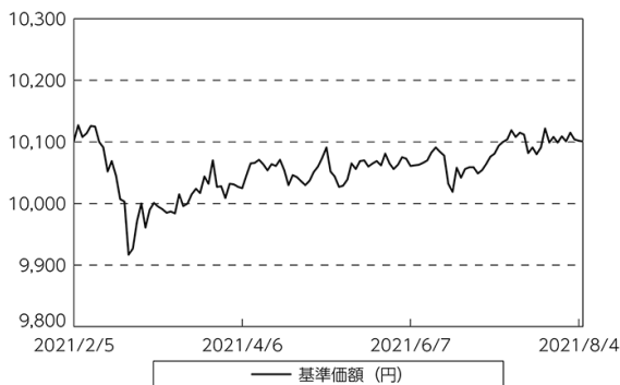
基準価額等の推移