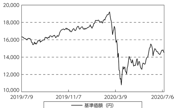
基準価額等の推移