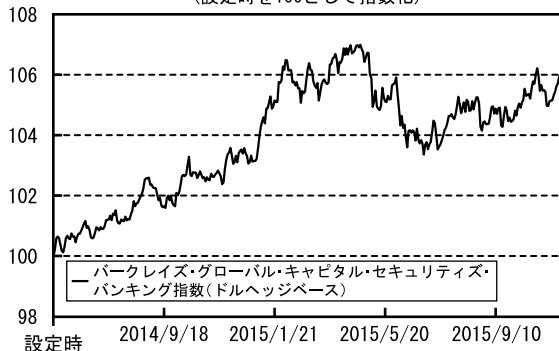
債券市況の推移 （設定時を100として指数化）

（注）バークレイズ・グローバル・キャピタル・セキュリティズ・バンキング指数とは、バークレイズ社が算出するグローバルベースのハイブリッド証券のうち、銀行セクターが発行する証券の値動きを示す代表的な指数です。