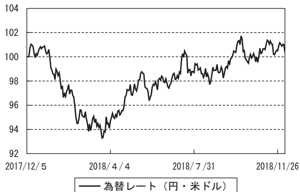
為替市況の推移 (期首を100として指数化)