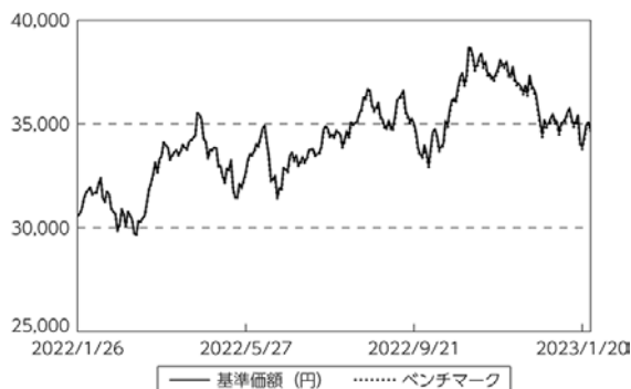
基準価額等の推移

(注) ベンチマークは期首の値をファンド基準価額と同一になるよう指数化しています。