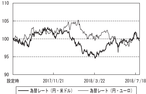
為替市況の推移 (設定時を100として指数化)