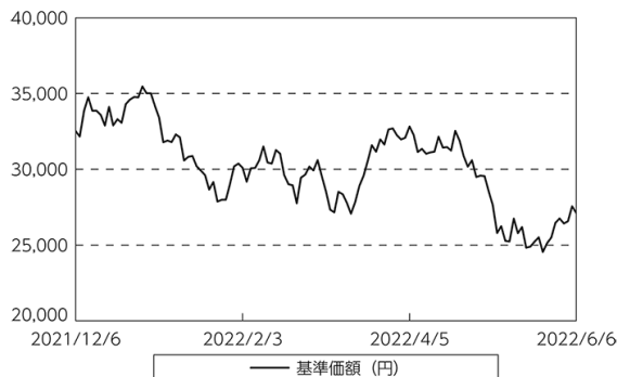
基準価額等の推移