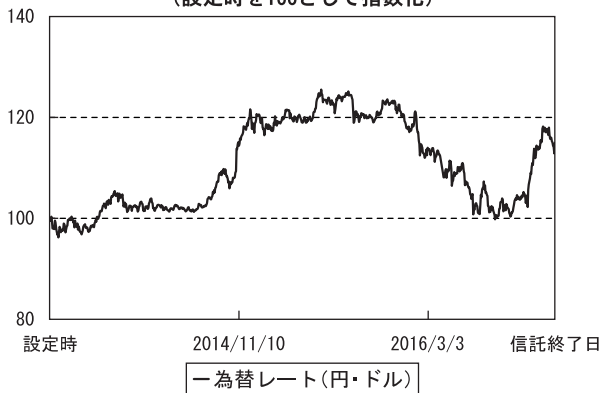
為替市況の推移 （設定時を100として指数化）