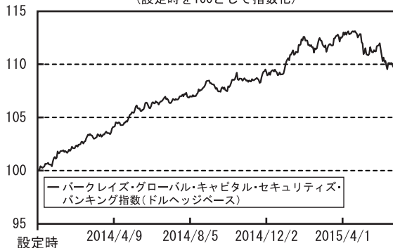
債券市況の推移 （設定時を100として指数化）

（注）バークレイズ・グローバル・キャピタル・セキュリティーズ・バンキング指数とは、バークレイズ社が算出するグローバルベースのハイブリッド証券のうち、銀行セクターが発行する証券の値動きを示す代表的な指数です。