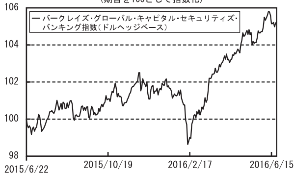
債券市況の推移 （期首を100として指数化）

（注）バークレイズ・グローバル・キャピタル・セキュリティズ・バンキング指数とは、バークレイズ社が算出するグローバルベースのハイブリッド証券のうち、銀行セクターが発行する証券の値動きを示す代表的な指数です。