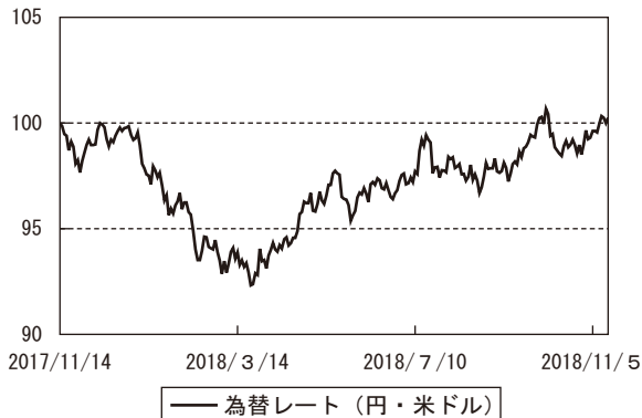
為替市況の推移 (期首を100として指数化)