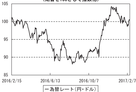
為替市況の推移 (期首を100として指数化)