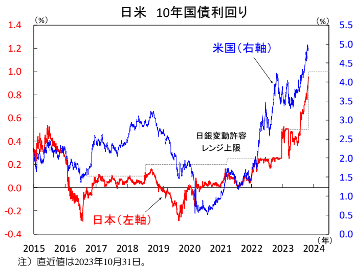
【図1】日銀は長期金利操作の上限を再拡大

日銀が新たに公表した経済・物価情勢の展望（展望レポート）によると、消費者物価（除く生鮮食品）の予想は2023年度が前年比+2.8%、2024年度が同+2.8%、2025年度が同+1.7%へ、前回7月からそれぞれ上方修正されました（図3）。先行きの物価見通しは「基調的物価上昇率は見通し期間終盤にかけ2%へ徐々に高まる」とされました。先行き見通しが依然として日銀の物価安定目標+2%を達成できず、マイナス金利の解除はまだ見通せない状況です。マイナス金利解除の検討は世界経済の安定成長が条件となるため慎重な判断が必要と考えられます。金融政策の正常化には時間を要し、来年前半の米国経済減速や利下げ期待の高まりを受けて、国内長期金利は再び低下する場面もありそうです。日銀の政策変更のタイミングやインフレ見通しについて、今後も植田総裁の発言が注目されます。（本江）