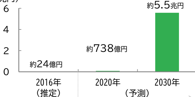
・・・（図4）遺伝子治療薬の市場規模（日本、米国、欧州）（兆円）

遺伝子治療薬の市場規模は2016年から2030年にかけて、約2,300倍にまで拡大すると予想されています（図4）。