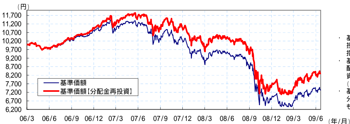
基準価額、基準価額(分配金再投資)の推移 (2006年3月17日～2009年7月6日)

7月6日現在の基準価額は、7,331円、前期末比67円のプラスとなりました。当期の分配金は、基準価額水準等を勘案し1万口当たり(税引前)40円としました。今後の運用状況によっては、分配金額が変わる場合、あるいは分配金が支払われない場合がございます。