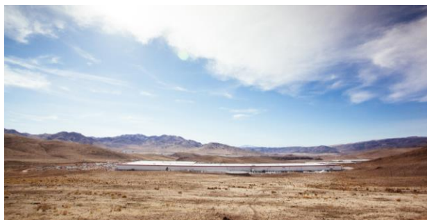
ネバダ州にあるテスラのギガファクトリー