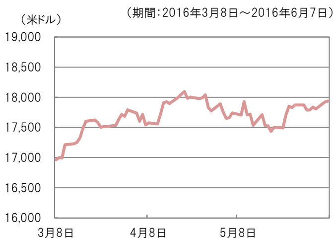
ダウ・ジョーンズ工業株価平均の推移