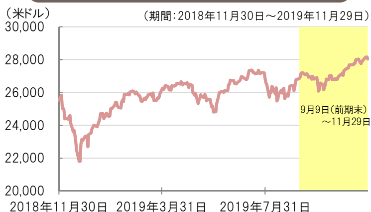
ダウ・ジョーンズ工業株価平均の推移