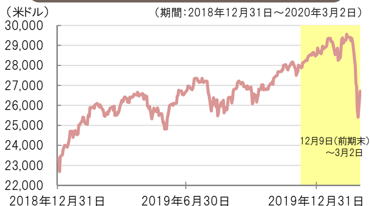
ダウ・ジョーンズ工業株価平均の推移