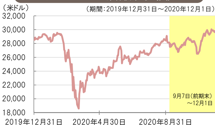
ダウ・ジョーンズ工業株価平均の推移