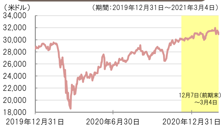
ダウ・ジョーンズ工業株価平均の推移