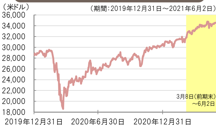
ダウ・ジョーンズ工業株価平均の推移