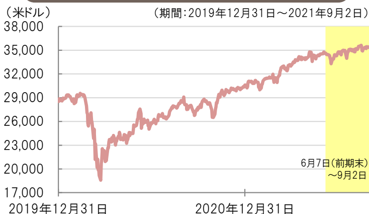
ダウ・ジョーンズ工業株価平均の推移