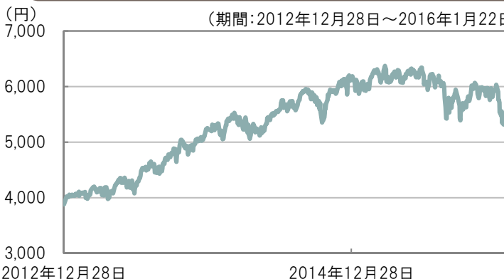
NASDAQオープン Bコース 基準価額の推移