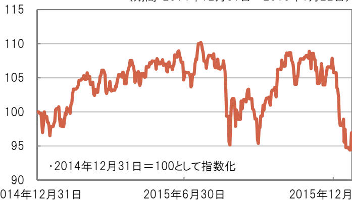
米ドル(対円)の推移